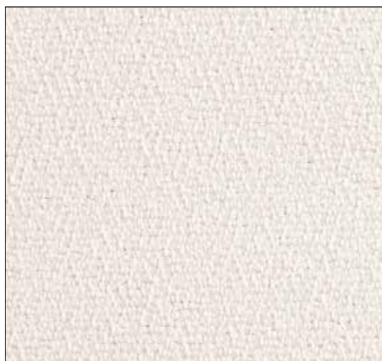
FIBER 1 col. 0001